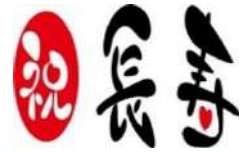
令和2年度姉体地区敬老対象者数(6月30日現在)