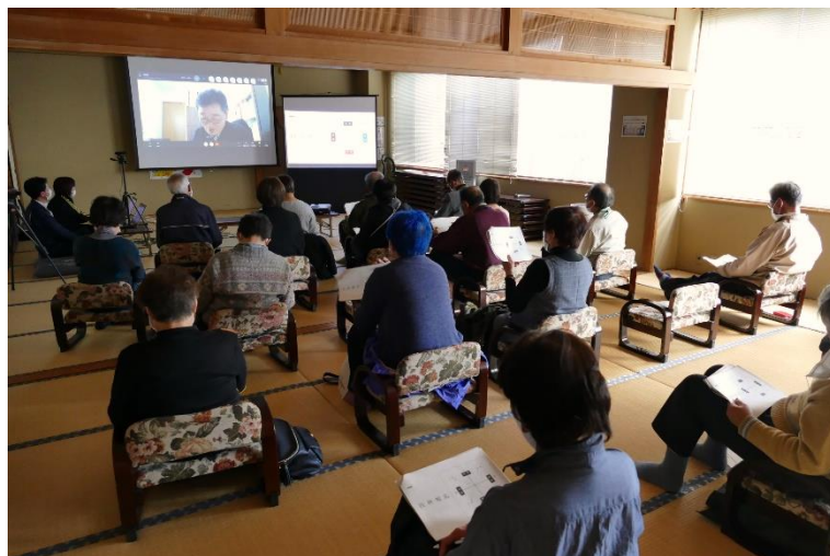
オンラインの様子