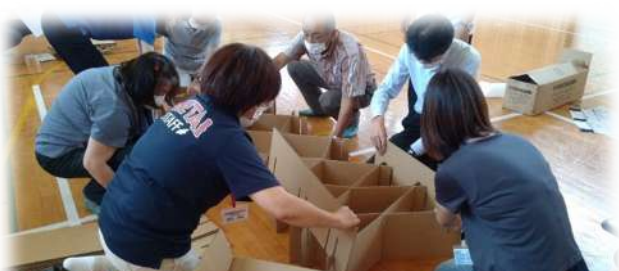
思っていたよりも、簡単に組み立てることが出来ました。