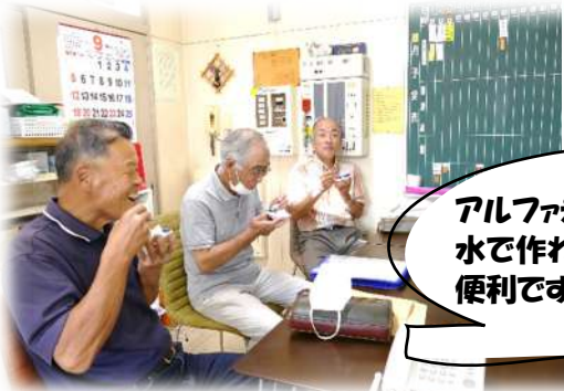
アルファ米を試食。 水で作れるので、災害時にとっても 便利です(〇)!