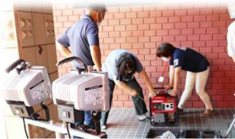
発電機のエンジンを～… なかなかかかりません(@@:)