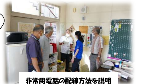
非常用電話の配線方法を説明