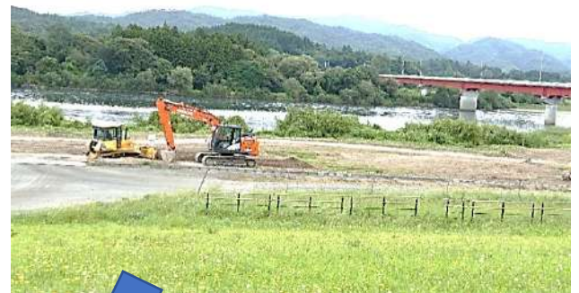
整地後の水辺プラザ