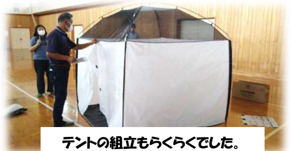
テントの組立もうらくらくでした。