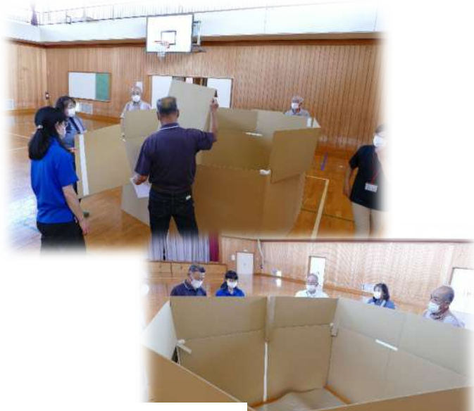
ダンボールの間仕切り 暖かそう…かな?