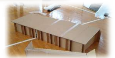
ダンボールベッド完成! とても頑丈です。