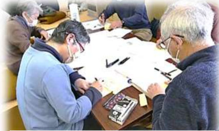
思いつく不安ごとを書き出し中