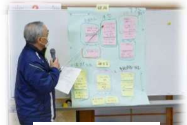
課題と解決策を発表