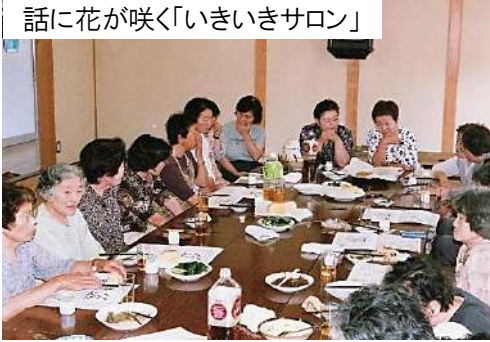
話に花が咲く「いきいきサロン」