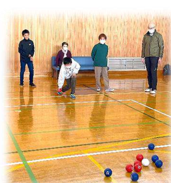
ボッチャは蹴っても 転がしてもOK