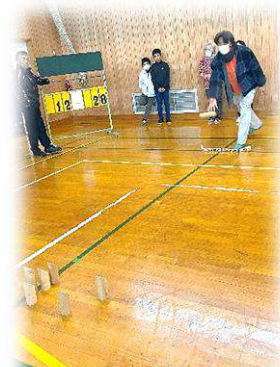
モルック 狙いを定めて…