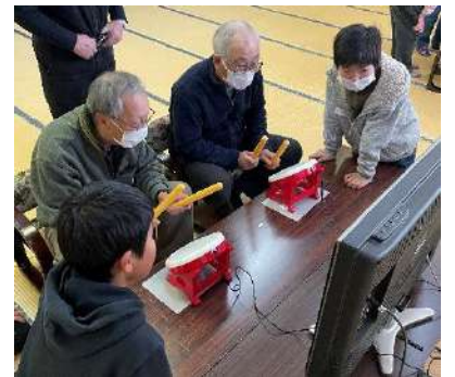
宿子ども会とeスポーツ体験