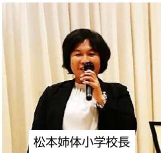
松本姉体小学校長