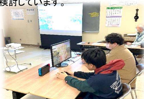
大人との闘いもありました！