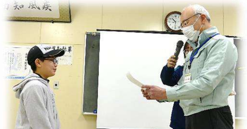
優勝おめでとうございます！