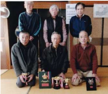
宿グラウンドゴルフ同好会